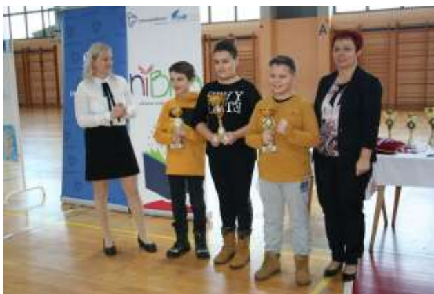
Zmagovalci v kategoriji otroci.