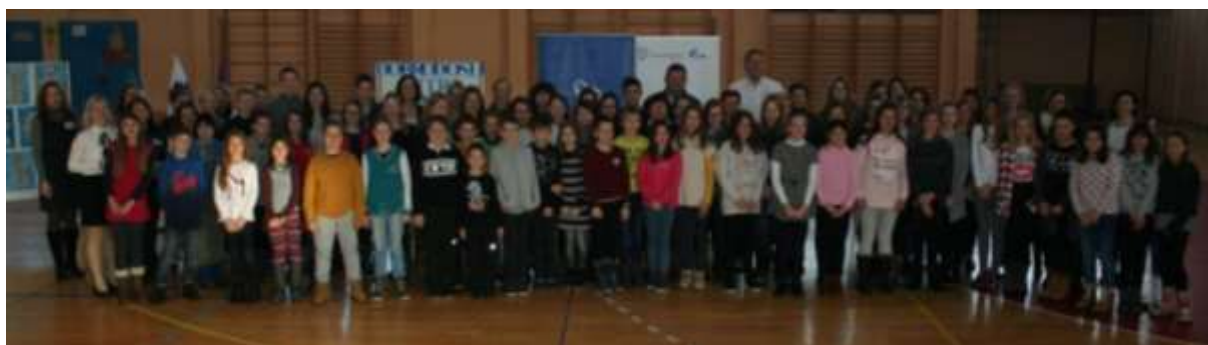
Skupinska fotografija o pričetku tekmovalnega dne