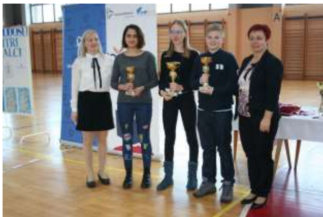
Zmagovalci v kategoriji juniorji.