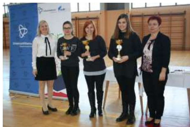
Zmagovalke v kategoriji odrasli.